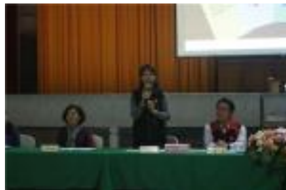
家長會長參與班親會