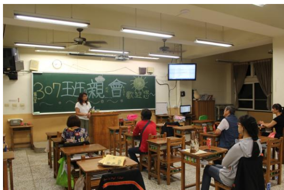
導師與家長意見交流