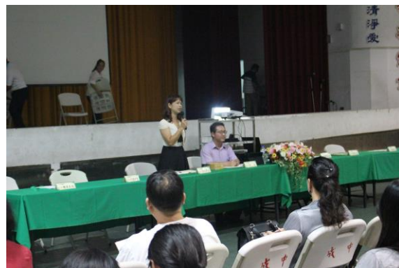
家長會長參與班親會