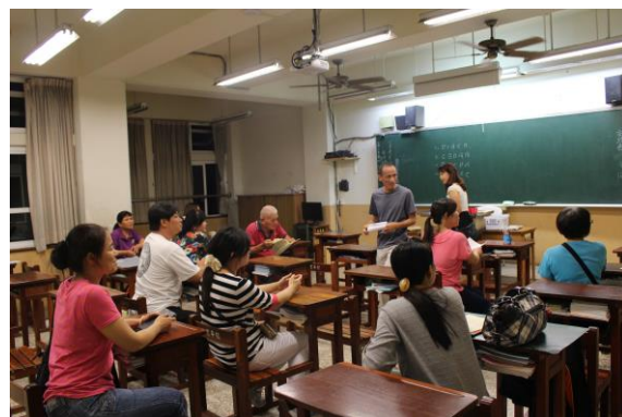
導師與家長意見交流