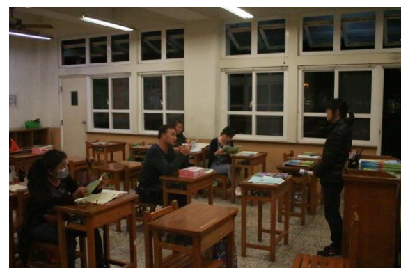
導師與家長意見交流