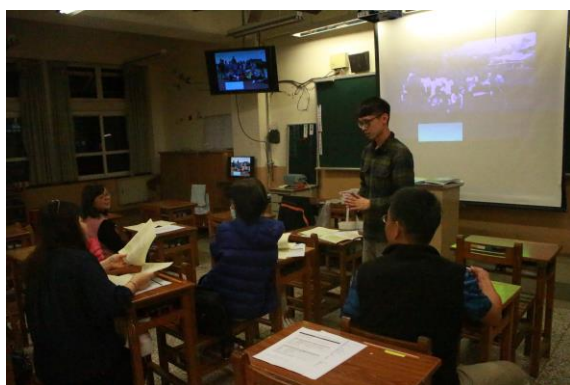
導師與家長意見交流