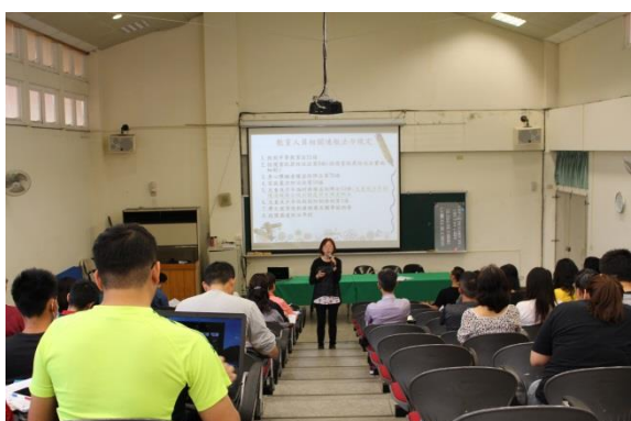
說明：學員專注聆聽