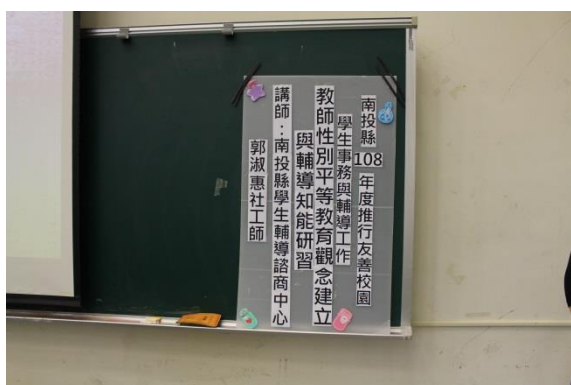
說明：研習活動看板