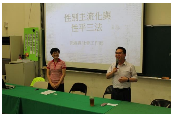
說明：校長致詞與介紹講師