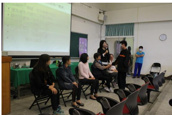
學生辨別媽媽的手