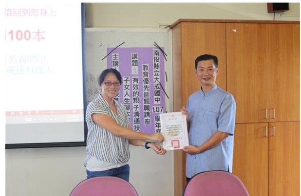
輔導主任頒發感謝狀