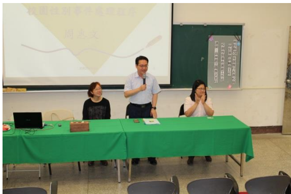
說明：校長致詞與介紹講師