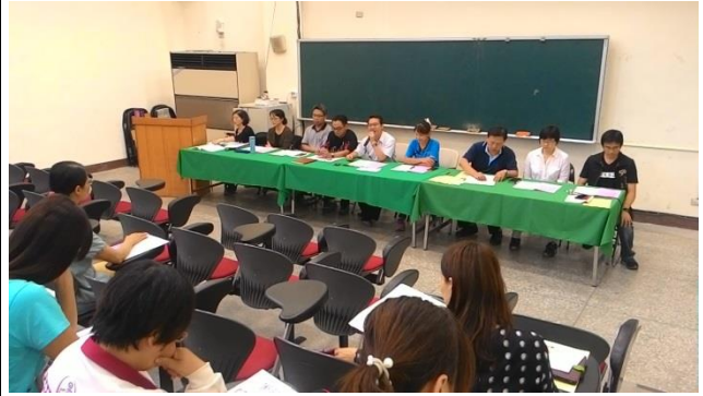
教師專注研讀資料