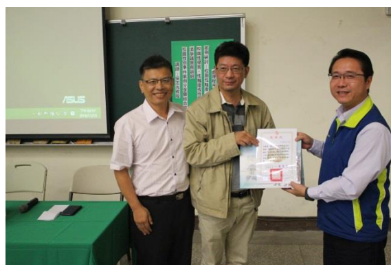
說明：校長頒發感謝狀