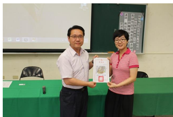
說明：校長頒發感謝狀