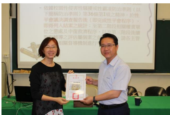
說明：校長頒發感謝狀