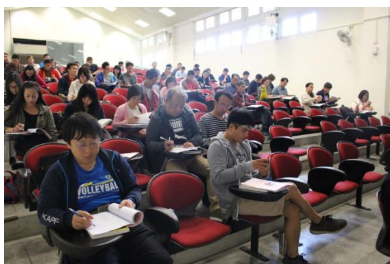
說明：學員專注聆聽