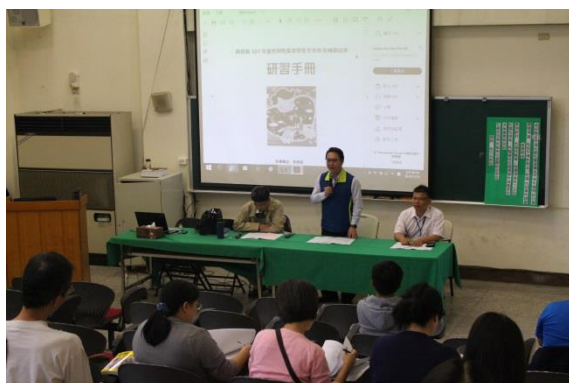
說明：校長致詞與介紹講師