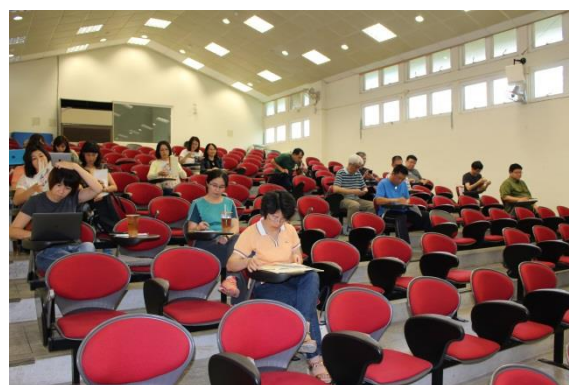
說明：學員專注聆聽