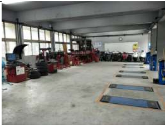
同德高中 汽車維修場