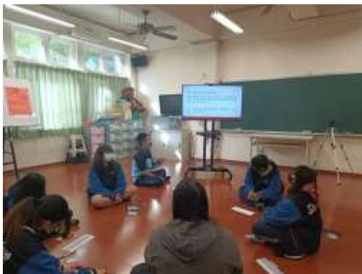
說明：學生專注參與