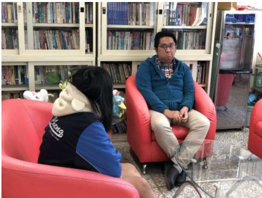
專任輔導教師輔導學生