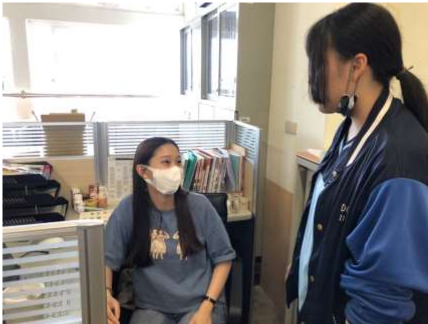
認輔教師輔導學生