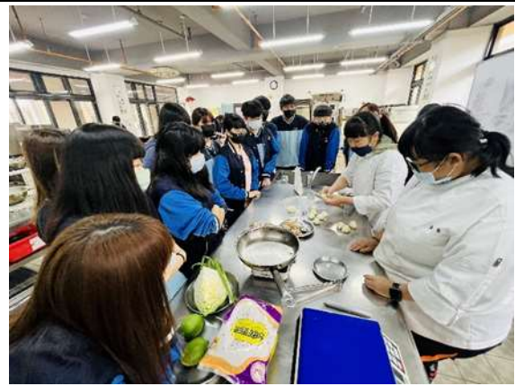
選擇同學有興趣、對升學有幫助、實用為主的 職群