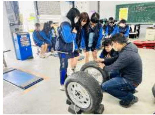
2023. 02. 14 動力機械換輪胎