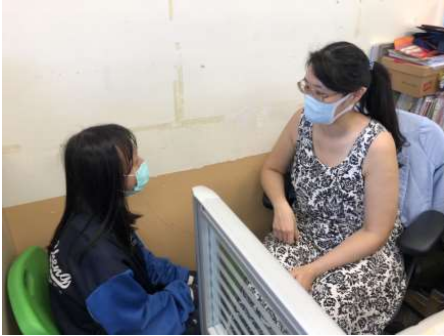
認輔教師輔導學生