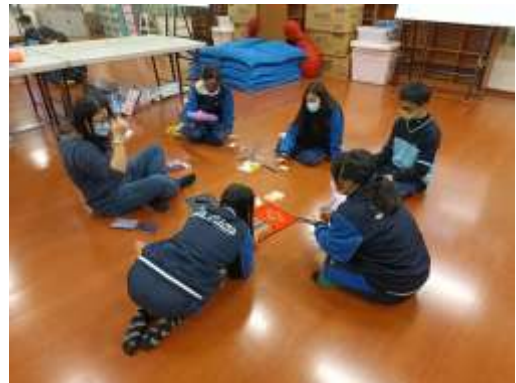
說明：專輔教師帶領學生認識情緒