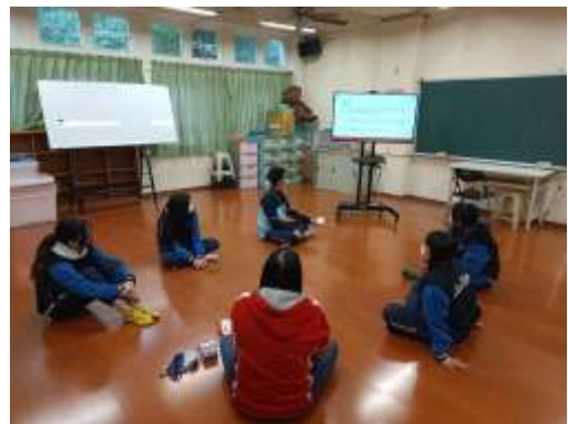
說明：學生專注參與