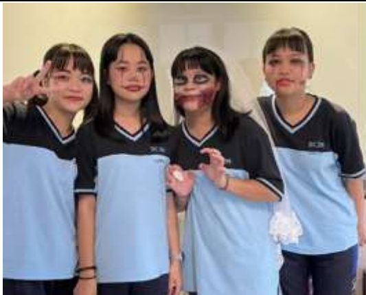
寓教於樂 萬聖節特殊妝