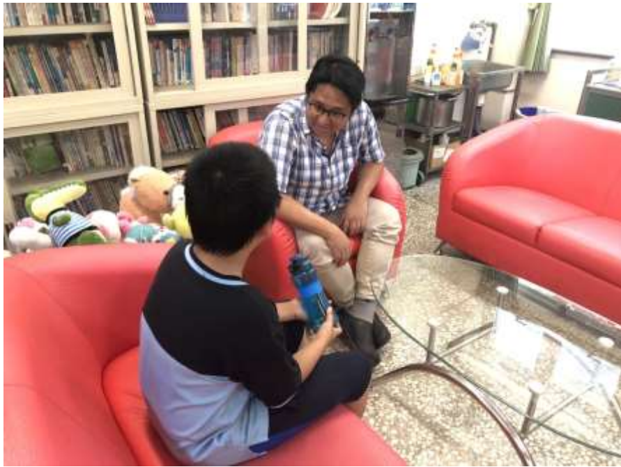
專任輔導教師輔導學生