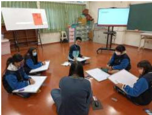
說明：專輔教師帶領學生認識情緒