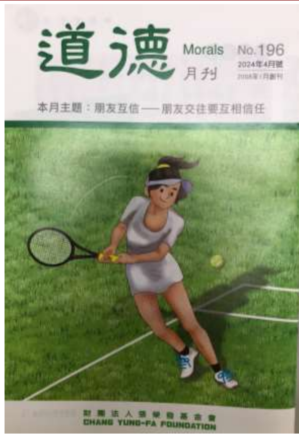
品德月刊-道德月刊