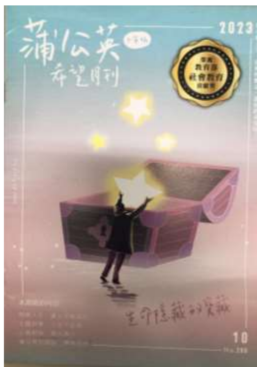
品德月刊-蒲公英月刊