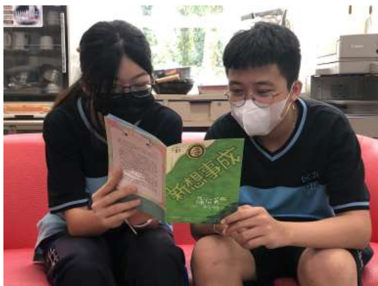
學生閱讀蒲公英月刊