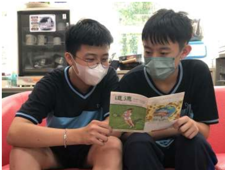
學生閱讀道德月刊