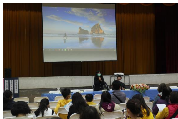
家長會長參與班親會