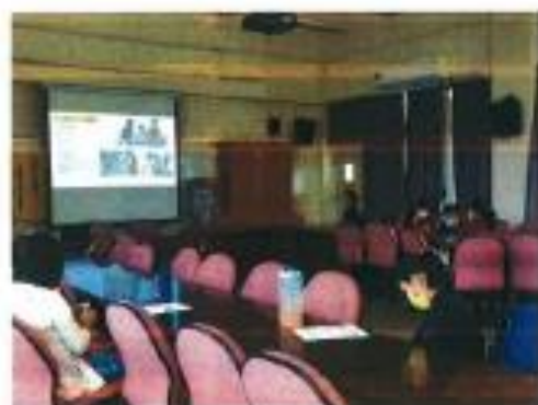
家庭教育中心宣導