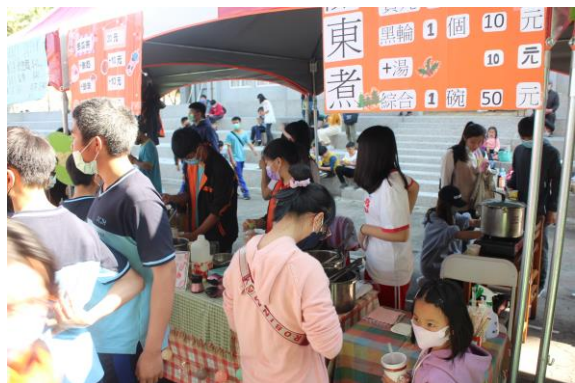
校慶活動親子園遊會