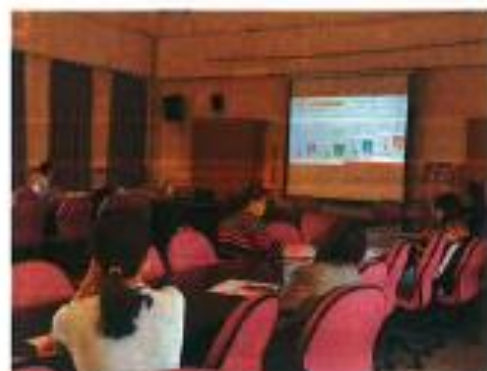
家庭教育中心宣導