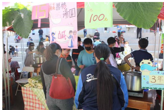
校慶活動親子園遊會