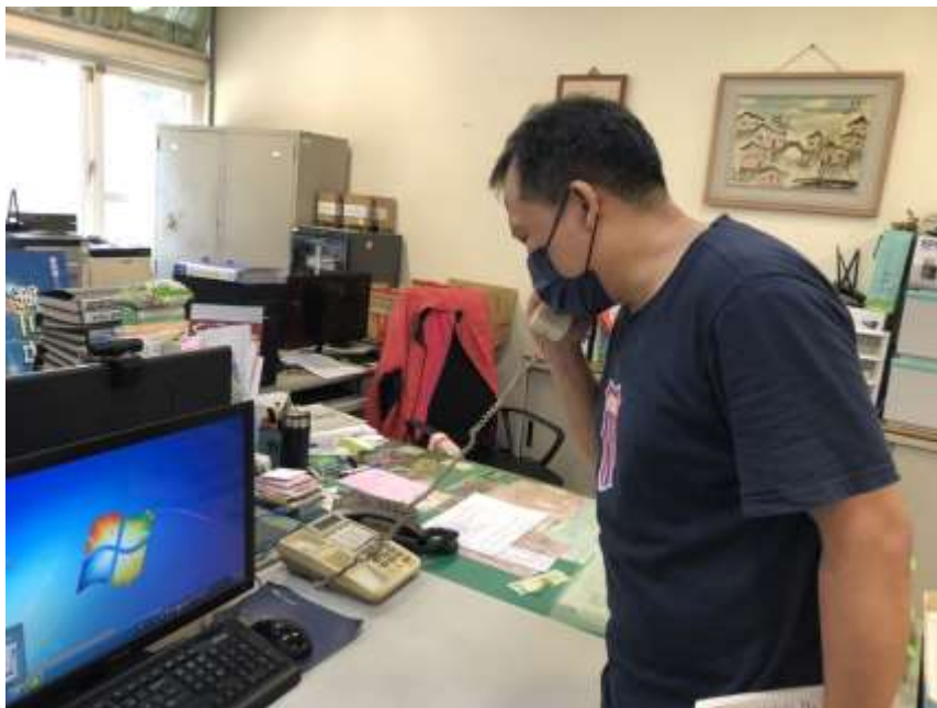
透過電話聯繫與家長聯繫