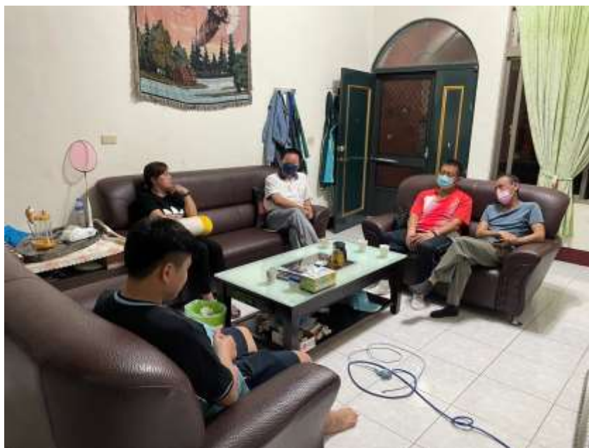
透過家庭訪問與家長聯繫