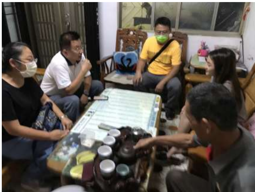
透過家庭訪問與家長聯繫