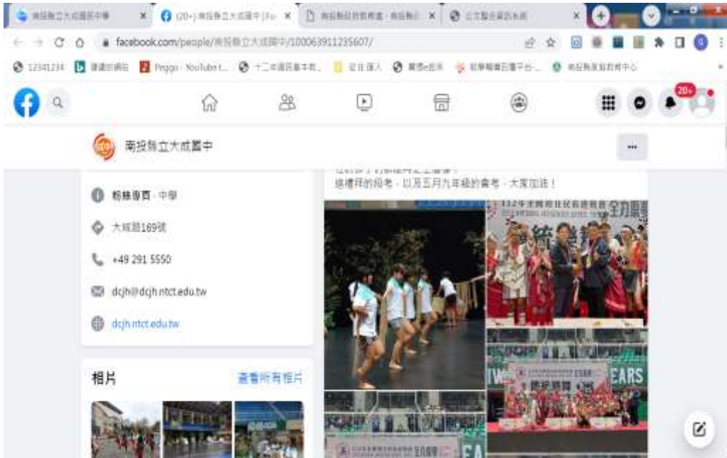
透過 facebook 與家長聯繫