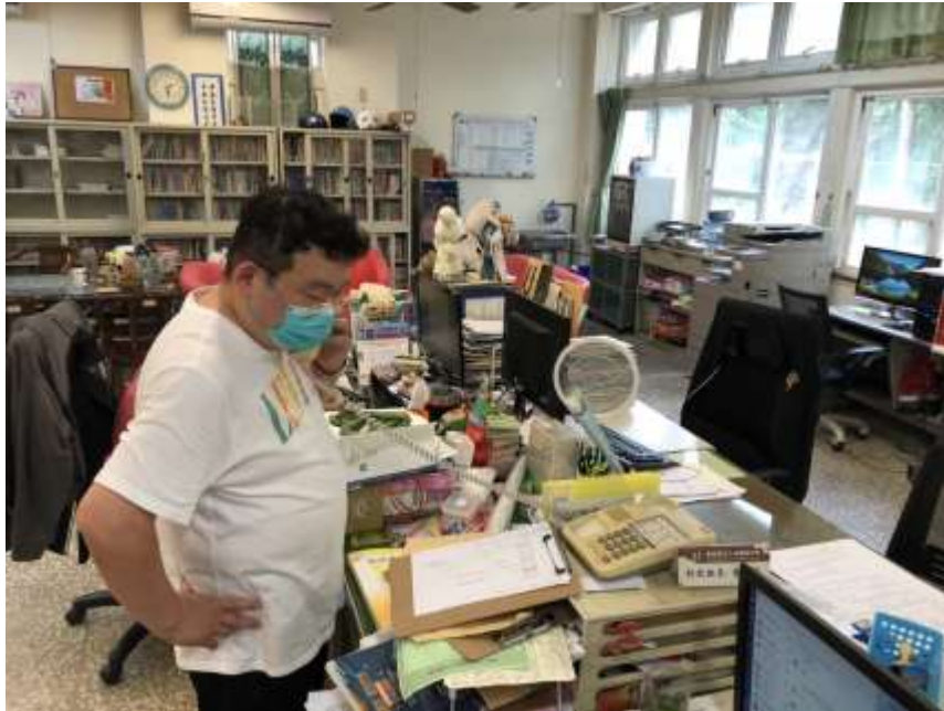
透過電話聯繫與家長聯繫