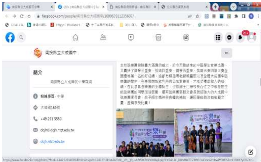
透過 facebook 與家長聯繫