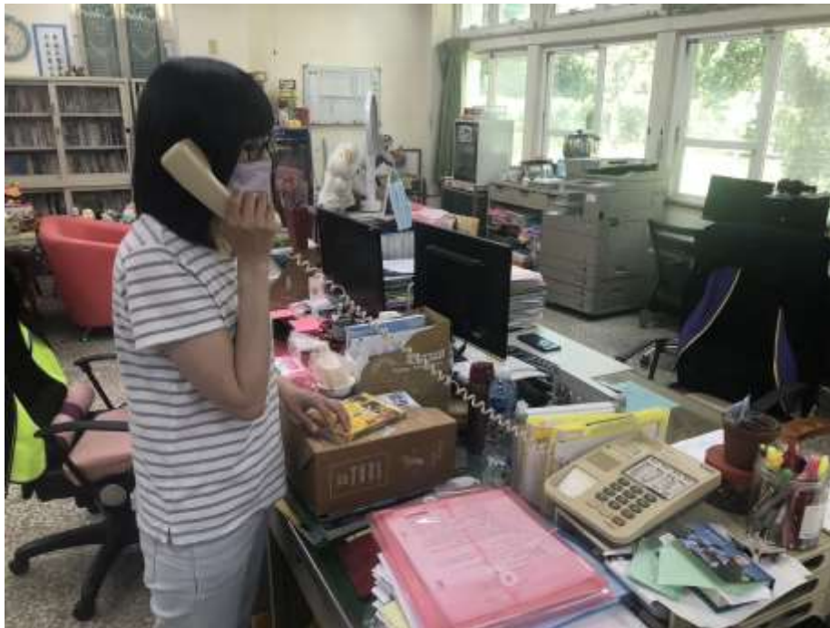
透過電話聯繫與家長聯繫