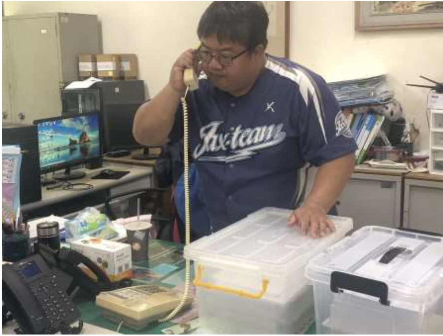
透過電話聯繫與家長聯繫