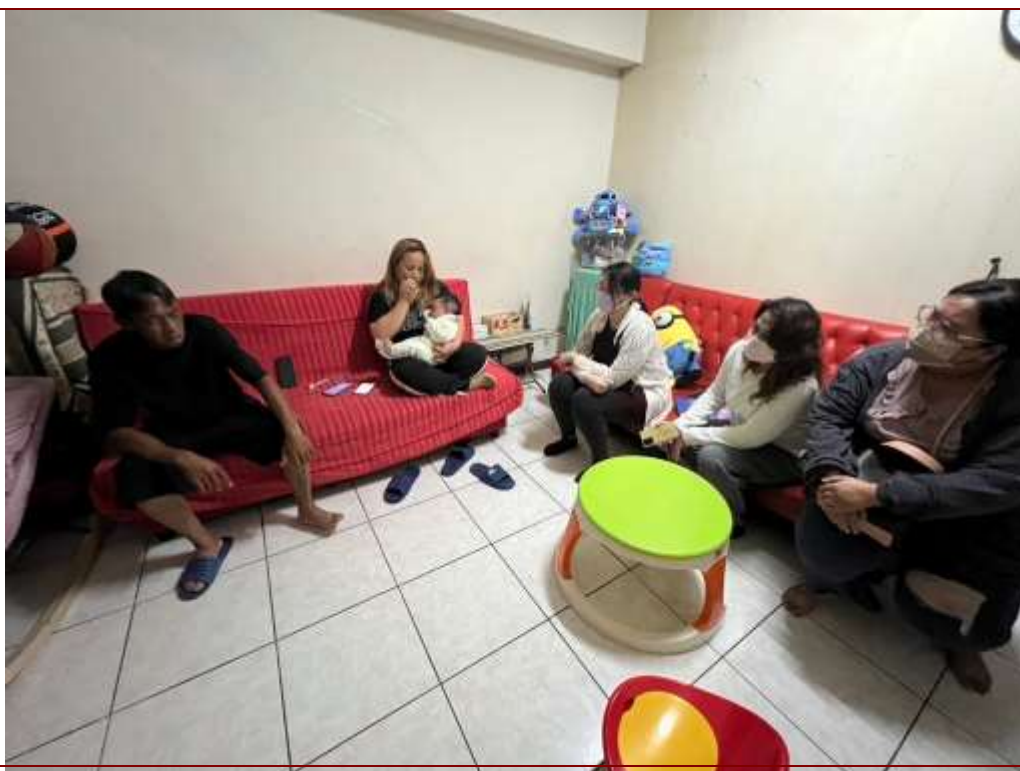
透過家庭訪問與家長聯繫