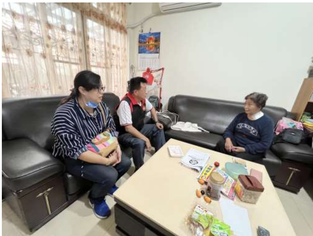
透過家庭訪問與家長聯繫