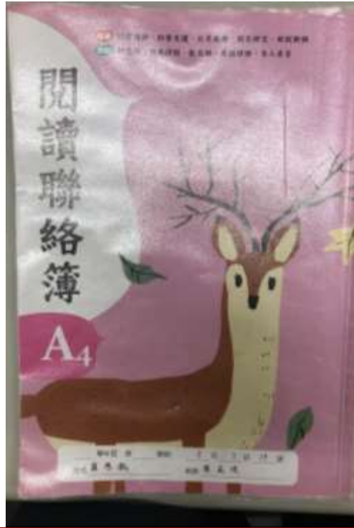
透過聯絡簿與家長聯繫