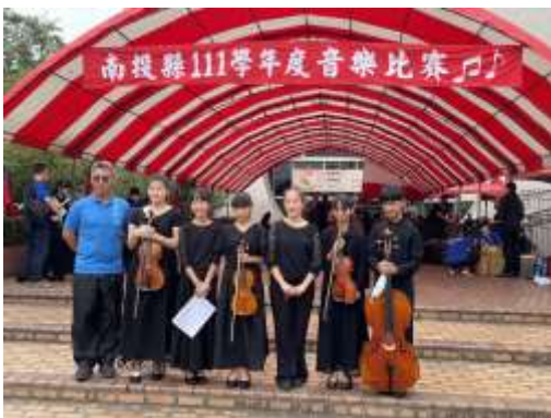
鋼琴鋼琴五重奏 B 組優等