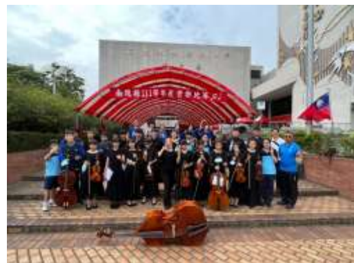
弦樂合奏 B 組優等