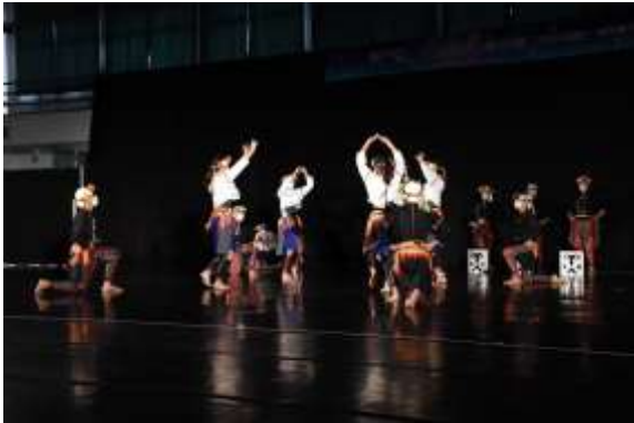
國中團體乙組民俗舞特優