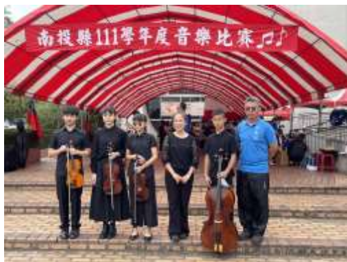
四重奏 B 組優等