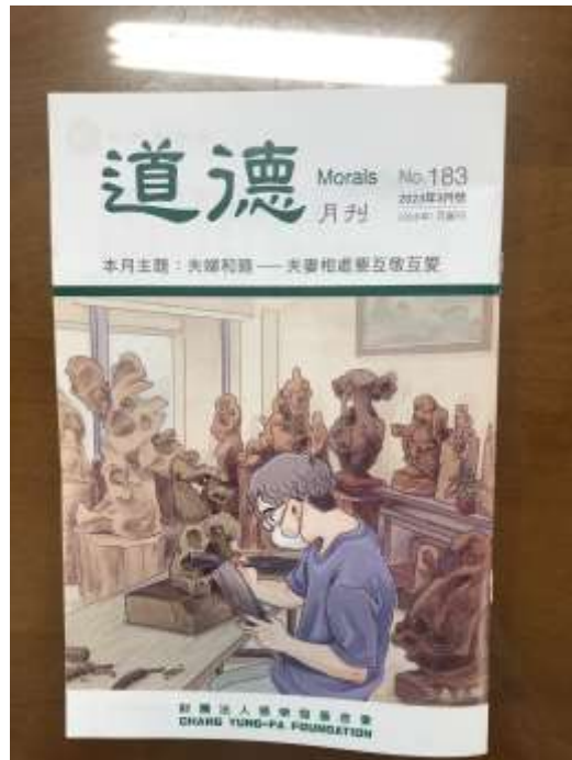
品德月刊-道德月刊