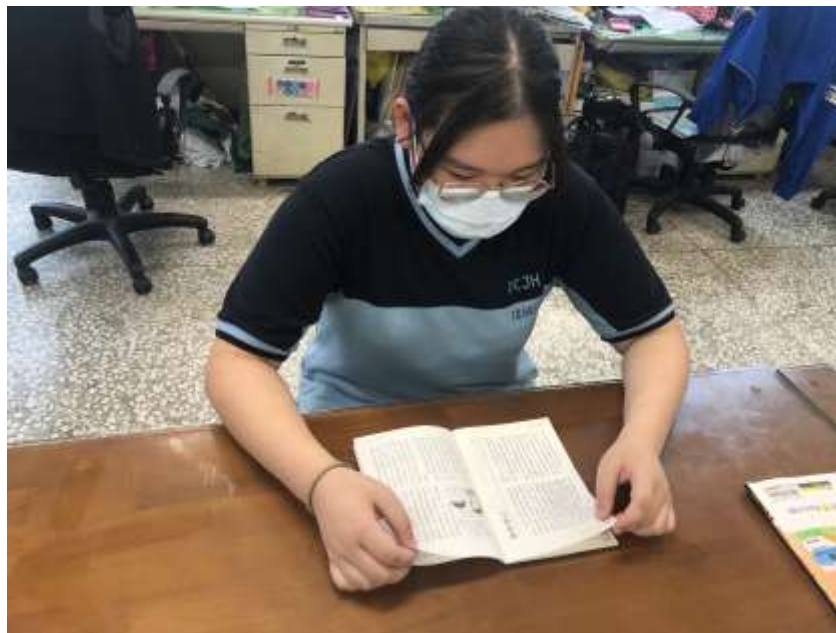
學生閱讀道德月刊