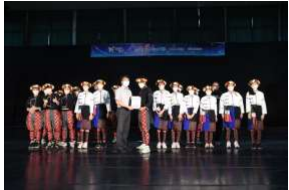
國中團體乙組民俗舞特優