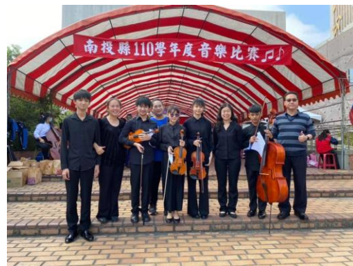
110 學年度南投縣音樂比賽鋼琴五重奏 B 組第 一名