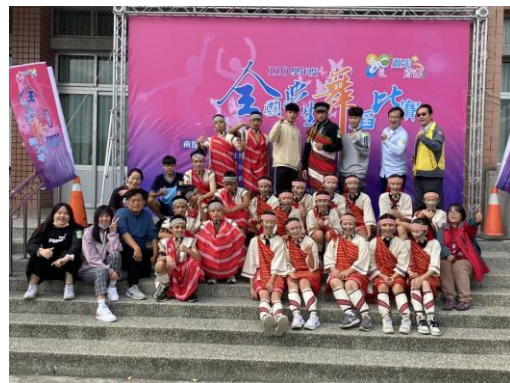
110 學年度南投縣舞蹈比賽南投縣初賽 特優第一名