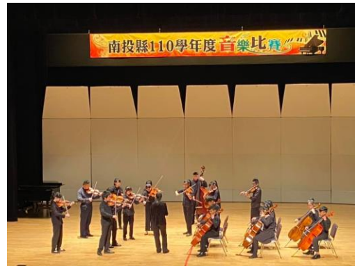
110 學年度南投縣音樂比賽弦樂合奏國中團體 B 組優等第一名