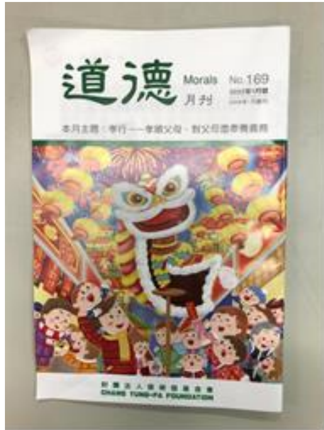
品德月刊-道德月刊