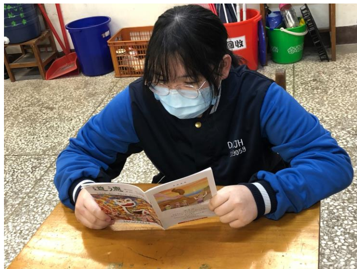
學生閱讀道德月刊