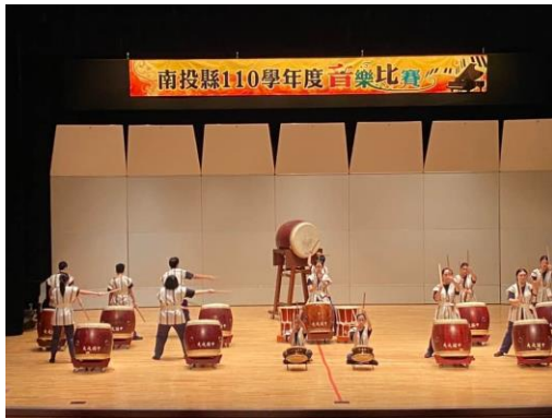
110 學年南投縣音樂比賽打鼓初賽 B 組優等