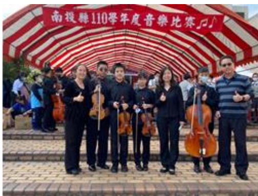
110 學年度南投縣音樂比賽弦樂四重奏 B 組第 一名