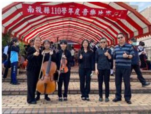
110 學年度南投縣音樂比賽鋼琴三重奏 B 組第 一名